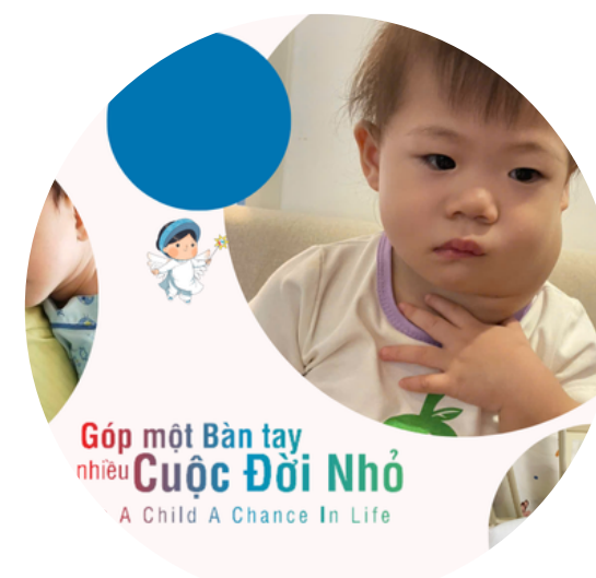
Triển khai các chiến dịch trên nền tảng trực tuyến Give.Now, MoMo, Give.Asia, App ThiênNguyen