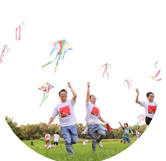
Sự kiện mini Cánh Diều Hy Vọng 16.11.2024