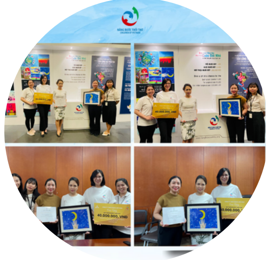
Chương trình Bước Chân Yêu Thương cùng Công ty Glints Việt Nam