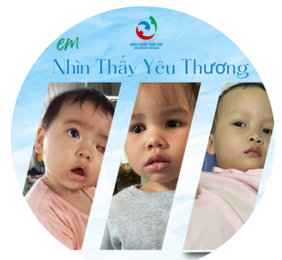
Tiếp tục triển khai "Cho Em Nhìn Thấy Yêu Thương" Chiến dịch Bệnh u nguyên bào võng mạc và ROP

Thay mặt các em nhỏ, gia đình, các y bác sĩ và toàn bộ tập thể nhân viên Quỹ Từ Thiện Nâng Bước Tuổi Thơ xin bày tỏ lòng biết ơn sâu sắc đến những tấm lòng vàng đã cùng chúng tôi góp một bàn tay cho nhiều cuộc đời nhỏ được điều trị trong tháng 11.2024.